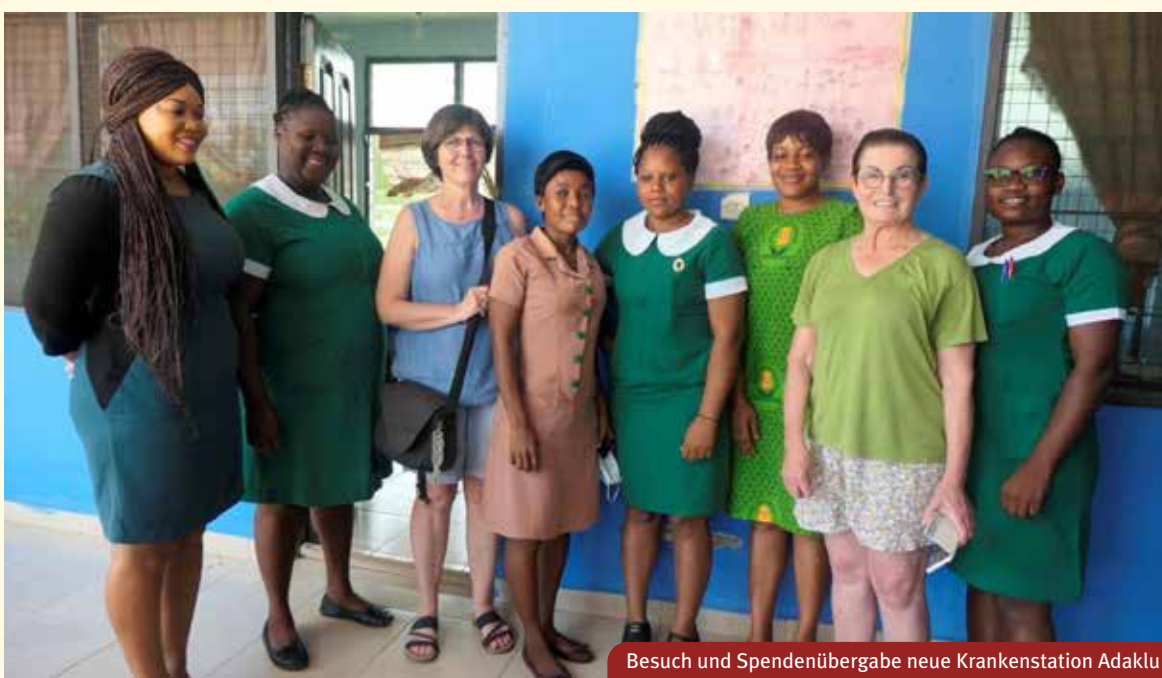
Besuch und Spendenübergabe neue Krankenstation Adaklu

Das sind so unsere nächsten größeren Ziele im Überblick. Der Ukraine Krieg, lässt mich zögern in allen Vorhaben. Ich kann nicht abschätzen wie das Spendenverhalten in der Zukunft ausfällt.