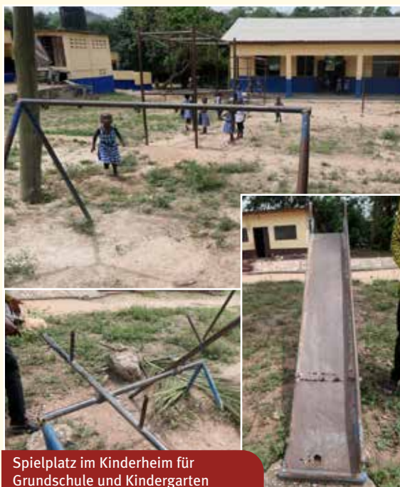
Spielplatz im Kinderheim für Grundschule und Kindergarten