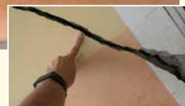
Risse im Kindergarten Adaklu